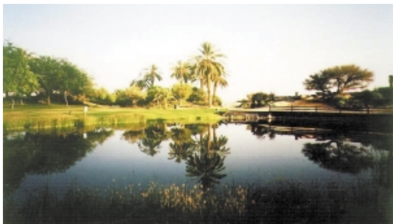
פארק ספיר בערבה

לפרטים נוספים: מרכז מידע לב הערבה 08-6582007, 1-800-225-007 www.negev-tour.co.il www.arava.co.il/tourism