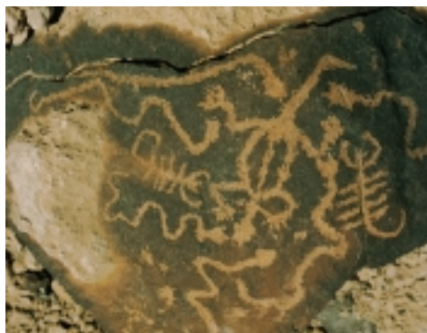
ציורי הסלע בפארק תמנע

ערוץ נוסף מדרום (מימין), אך אנו נמשיך בערוץ המרכזי עד לקניון האדום. הקניון הוא קטע קצר בנחל שני. אורכו כ-300 מטר בלבד, ולכן כדאי - תוך כדי קפיצות ומבצעי אקרובטיקה קלים - להרים את העיניים למעלה ולראות את הצורות היפות הנוצרות באבן החול ובקונגלומרט שמעליה. ביציאה מהקניון, במקום בו מתרחב הנחל, יש שביל העולה ימינה, מטפס מעל הקניון וחוזר לנחל שני ולחניון. משך הטיול כשעה עד שעתיים, מתאים לכל המשפחה.